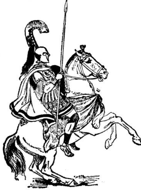
கிரேக்கக் குதிரைப்படை வீரன்

ஆத்தீனியர்களே! உங்களுக்குச் சில வார்த்தைகள்தான் சொல்லப் போகிறேன். வீரர்களுக்கு அதிக வார்த்தைகள் சொல்லத் தேவையில்லை. உங்களுக்குச் சில விஷயங்கள் தெரியவேண்டுமென்பதற்காக