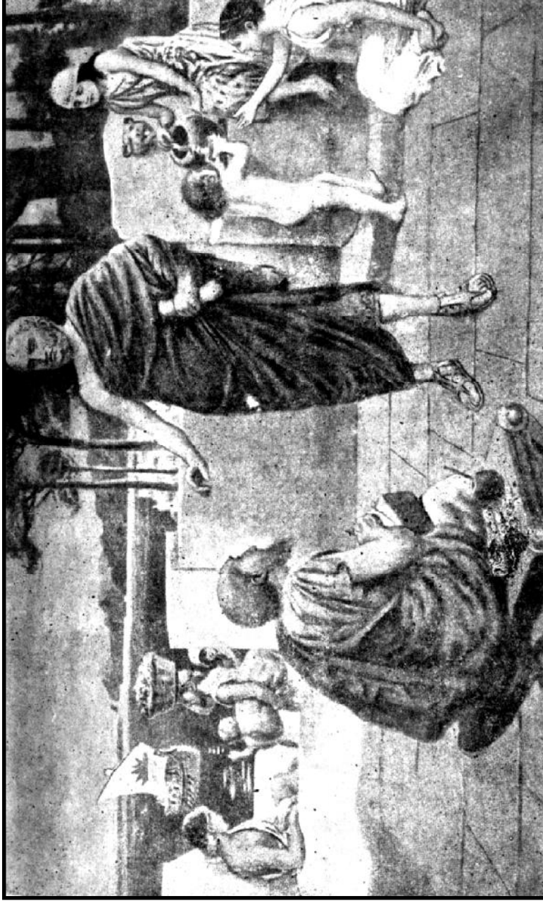
சரித்திரம் சொல்லும் துஸிழைஸ்