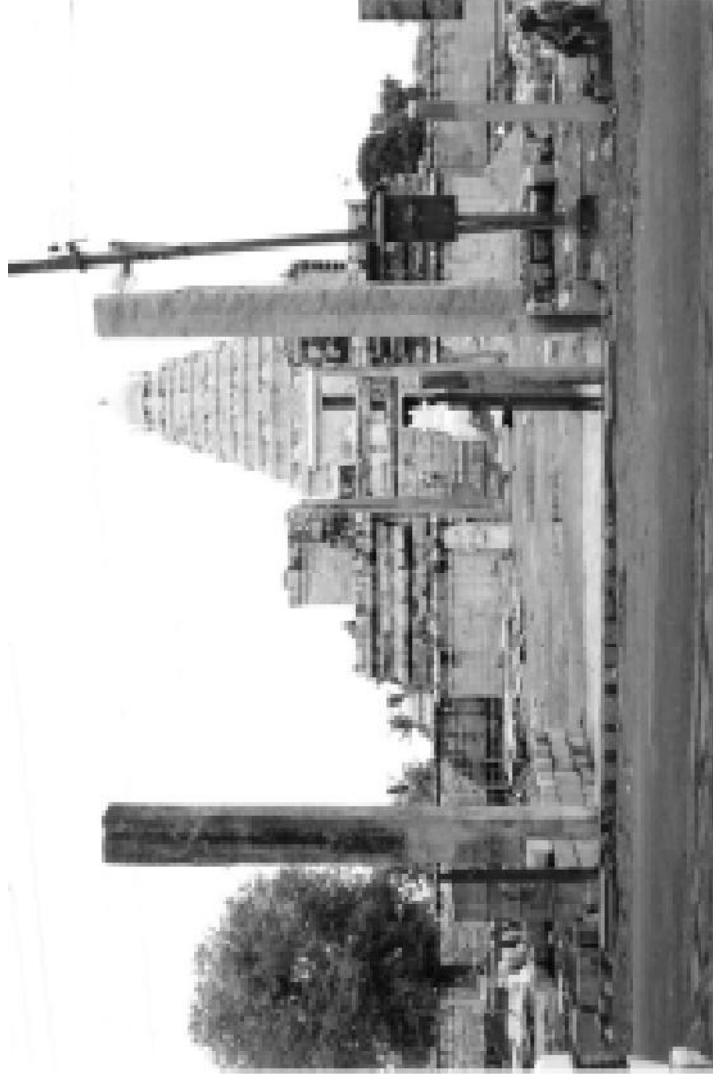
பண்டாரத்தாரின் உள்ளங்கவர்ந்த கங்கைகொண்ட சோழபுரம் கோயில் - ஆங்கிலேயர் உண்டாக்கிய சிதைவுக்குப் பின்பான தோற்றம்