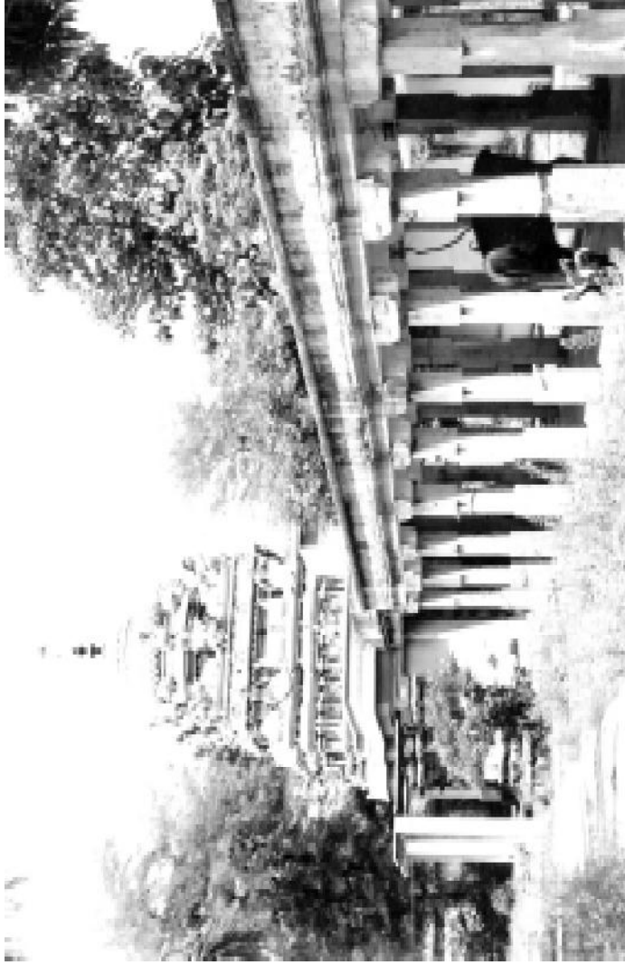
ஏரகரம் கோயில் - இதன் வளாகத்தில் புதைந்திருந்த கல்வெட்டுக் கற்களைப் பண்டாரத்தார் தோண்டித் துடைத்து ஏரகர வரலாற்றை வெளிப்படுத்தினார்.