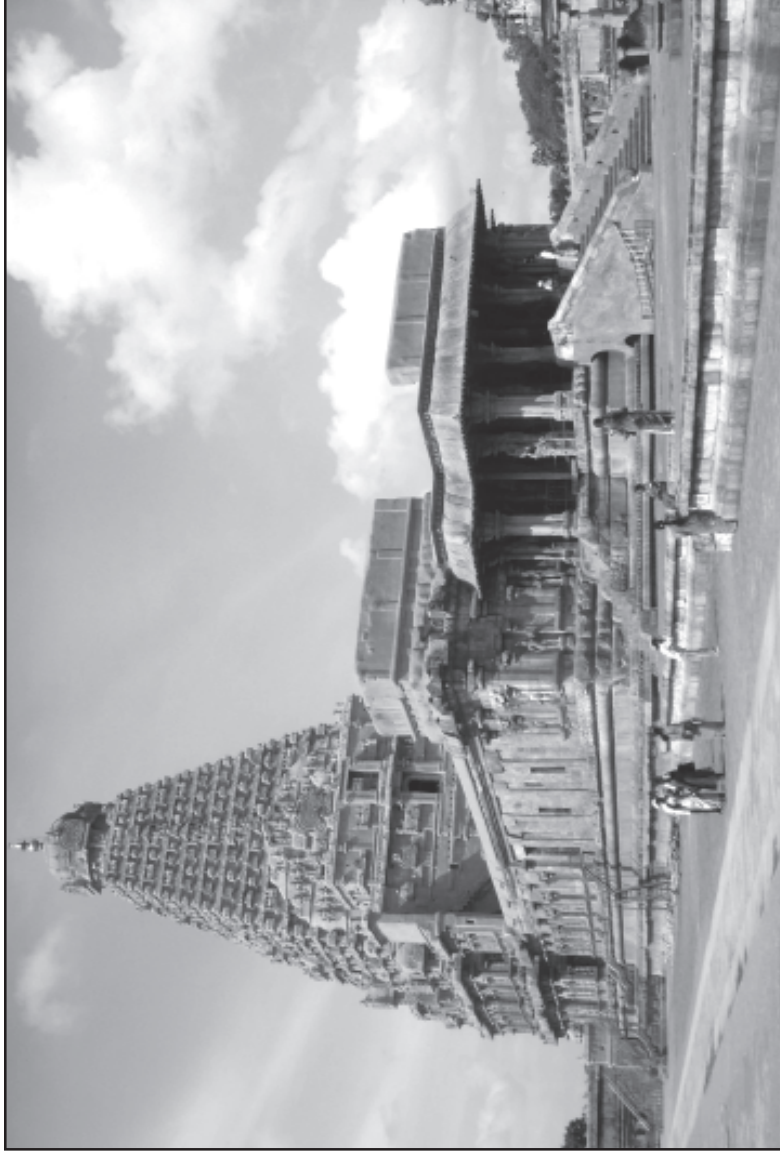
தஞ்சைப் பெரிய கோயில்

காத்து வந்தான்; பிற மதக் கோவில்களுக்குப் பொருள் உதவி செய்தான்; நிலங்களை மானியமாக விட்டான்.