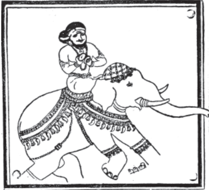
சுந்தரர் கயிலை செல்லுதல் - தஞ்சைப் பெரிய கோவில் ஓவியம்

இம்முடிவு பொருத்தமாயின், இச்சித்திரங்கள் சேக்கிழாரார்க்கு ஏறத்தாழ நூறு ஆண்டுகள் முற்பட்டன என்று கூறலாம்.