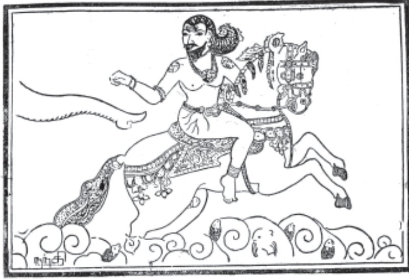
சேரமான் பெருமாள் கயிலை செல்லுதல்