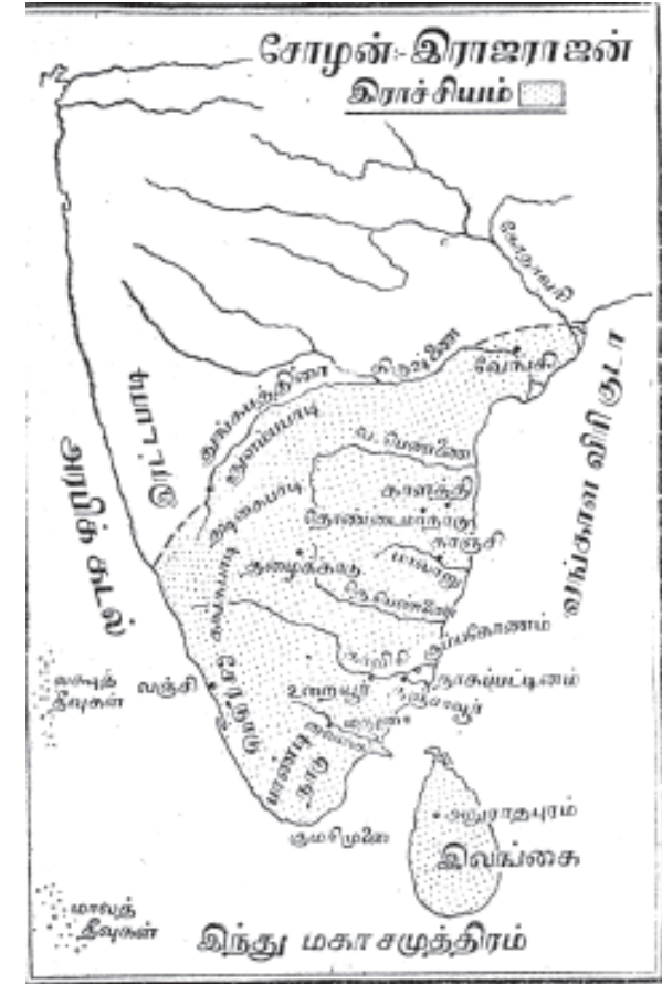
வேங்கி: வேங்கை எனவும் வழங்கும்.