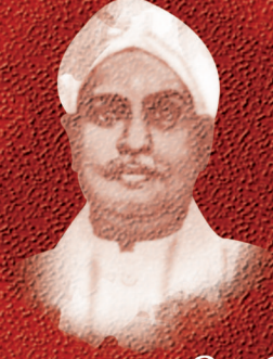
கரந்தைக் கவியரசு இரா. வேங்கடாசலம் பிள்ளை