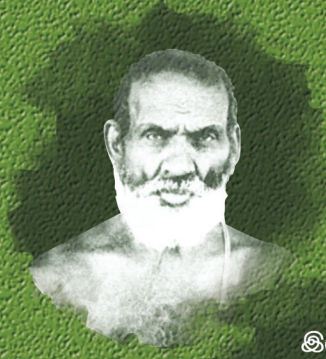
இலக்கணக்கடல் சி. கணேசையர்