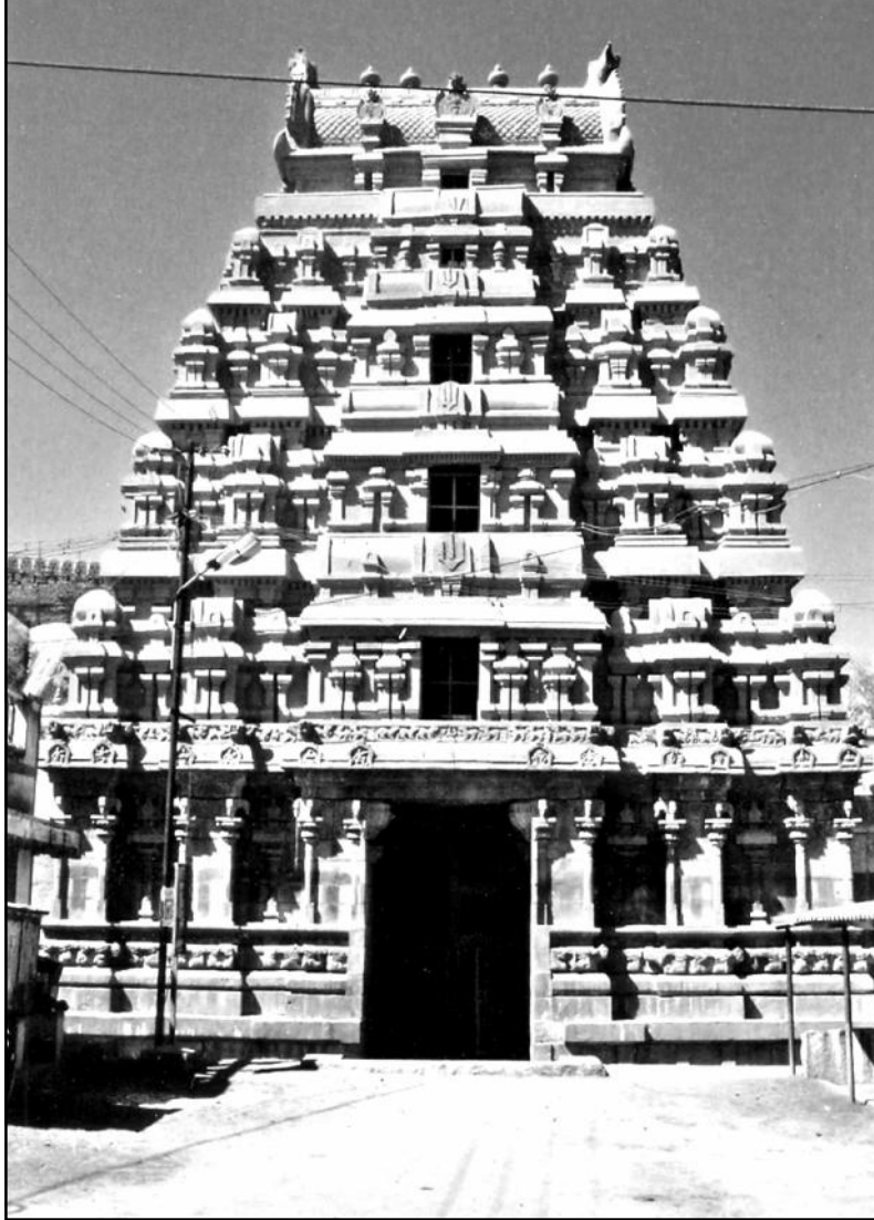
விஷ்ணு கோயில், திருமெய்யம், புதுக்கோட்டை மாவட்டம்