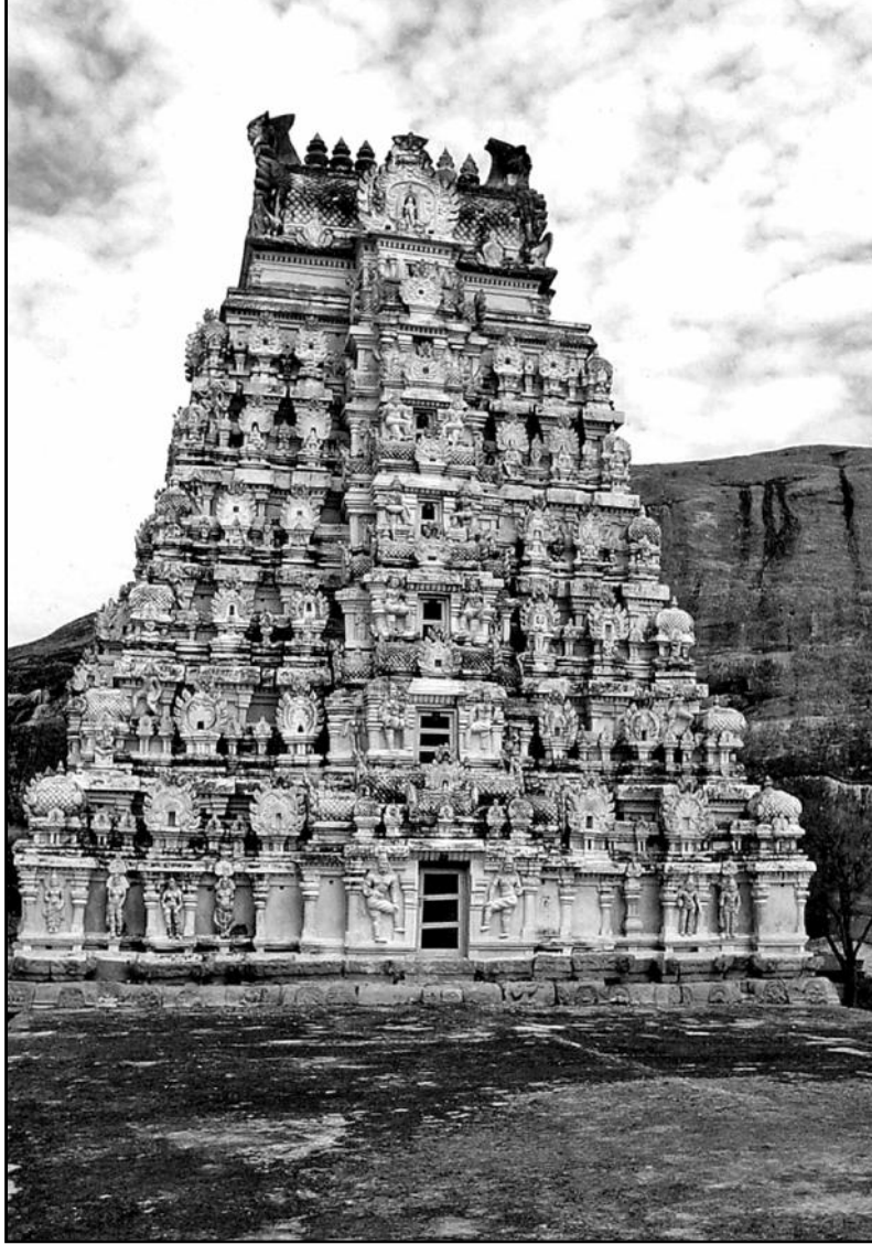
குடுமியான் மலைக் குடைவரைக் கோயில், புதுக்கோட்டை மாவட்டம்