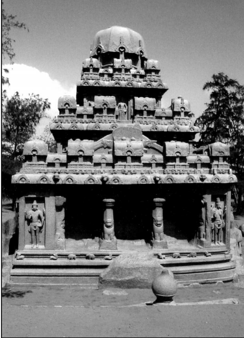
தர்மராச மண்டபம் மாமல்லபுரம், காஞ்சிபுரம் மாவட்டம்