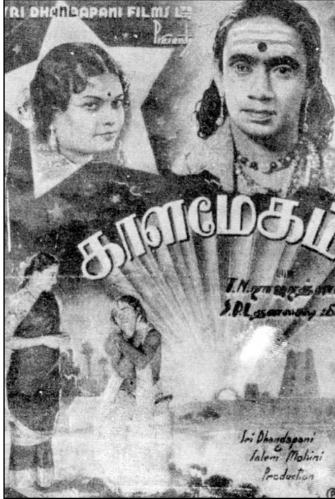
பாரதிதாசன் கதை - உரையாடல்