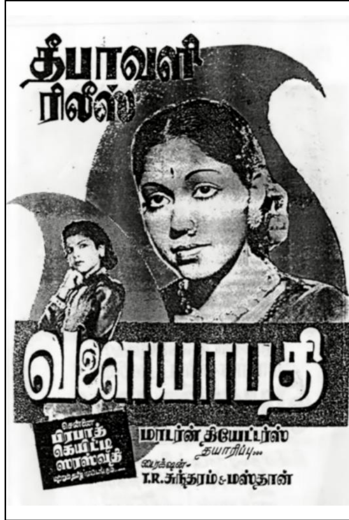
பாரதிதாசன் கதை - உரையாடல்