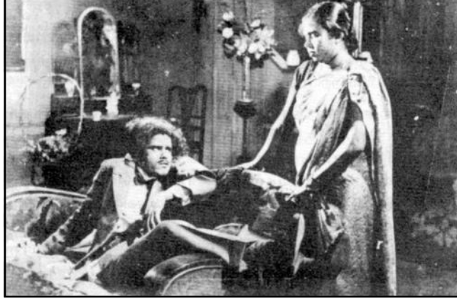
பாலாமணி - 1937 பாரதிதாசன் பாடல்கள்