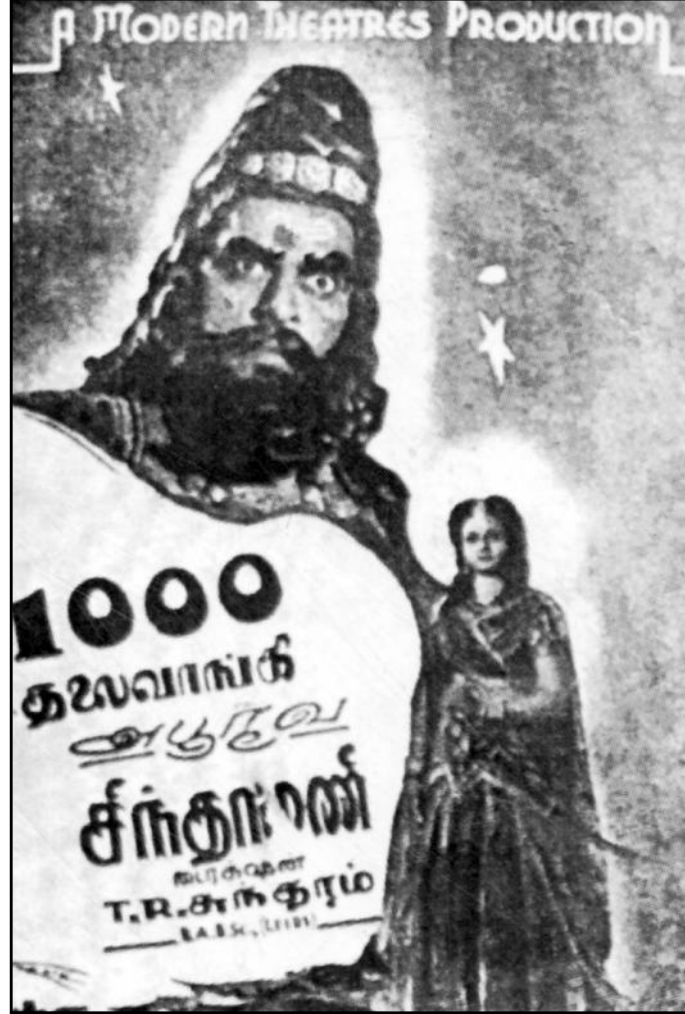
பாரதிதாசன் கதை - உரையாடல்