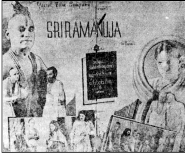
ஸ்ரீ ராமானுஜர் - 1938 பாரதிதாசன் பாடல்கள்