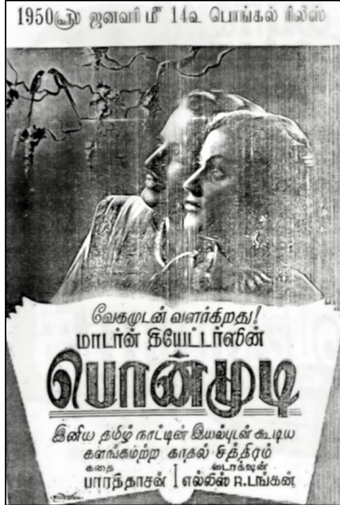
பாரதிதாசன் கதை - உரையாடல்