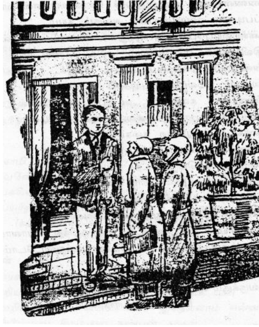
(காட்சி இரண்டு: கமலம் கோகிலம் முறையே சின்ன கொய்யா, பெரிய கொய்யா வேடத்திலுள்ள காட்சி.)