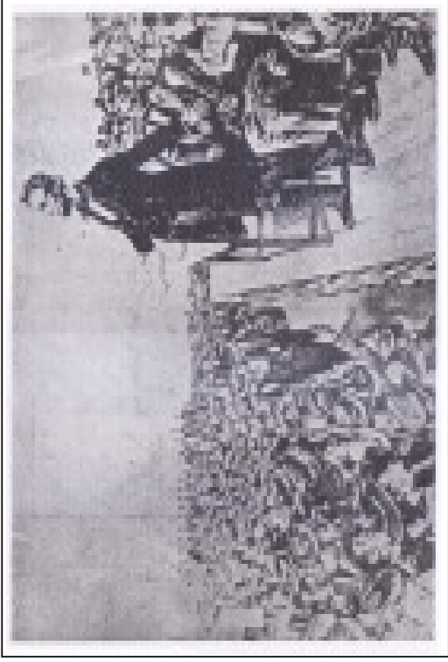
1863-ம் ஆண்டில் 'கொட்டிஸ் பெர்க்கில்' நடைபெற்ற உள்நாட்டுப் போரின்போது 'லிங்கன் பேசுதல்