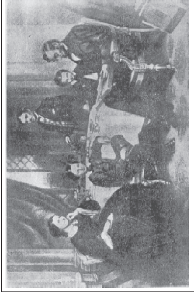
தம் குடும்பத்தினருடன் 'லிங்கன்'